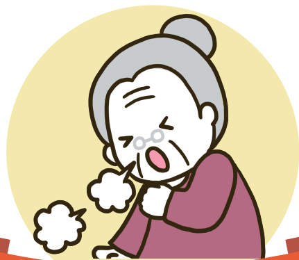
肺炎球菌ワクチン