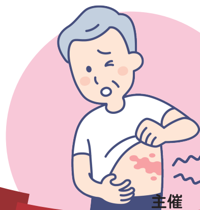
帯状疱疹ワクチン